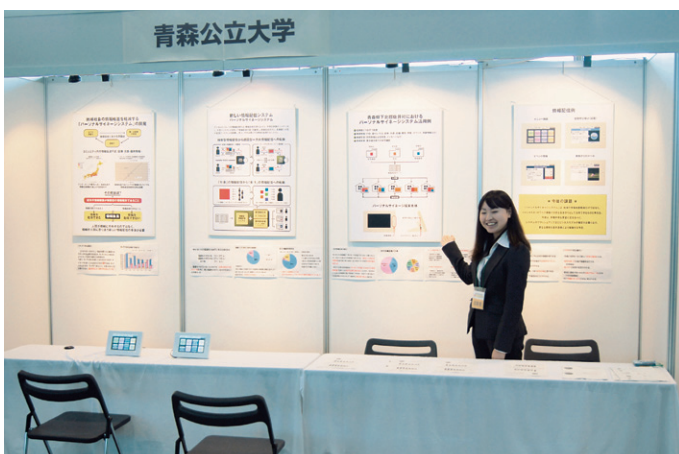
あおりICTクラウドフェスタの青森公立大学ブース。多くの人が実機に触れたり、概容を聞きに訪れ賑わいました。

現段階では、地域の情報格差軽減に焦点があてられていますが、ソーシャルネットワーク構築の大きな足がかりとして活用できるものとも考えられ、今後は多種多様な要望に応えられるよう、産学官連携により更なるシステムの改善を実施する予定です。