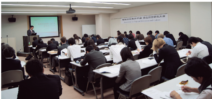
会場はほぼ満席となり、各発表に対して積極的な質疑応答等がなされました。